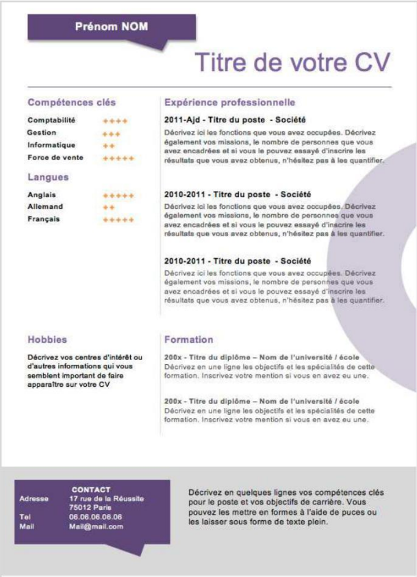
Exemples de Curriculum Vitae

Réalisez votre propre Curriculum Vitae en intégrant au moins les parties suivantes : Nom/Prénom, Contact, Profil, Expérience professionnelles, Formation, Compétences, Langues, Hobbies et Permis.